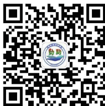
哈尔滨理工大学勤工助学中心 官方微信公众平台二维码

注：下面是哈尔滨理工大学勤工助学中心官方微信公众平台二维码，勤工助学兼职信息将在此平台发布。