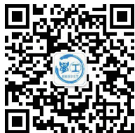
哈理工学工官方微信 公众平台二维码

※ 请各位家长、同学们扫描关注哈尔滨理工大学学生工作部（处）微信公众平台——“哈理工学工”，我们将在 2019 年 8 月 31-9 月 1 日新生报到前在微信公众平台推送新生来校（各校区）报到的参考交通路线、各学院辅导员办公地点及联系方式、2019 级新生班级等信息（二维码如下）。