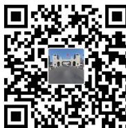
哈理工全景校园二维码